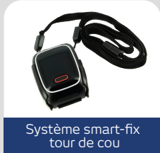
Système smart-fix tour de cou