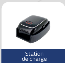
Station de charge