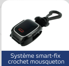
Système smart-fix crochet mousqueton