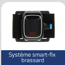
Système smart-fix brassard