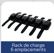
Rack de charge 6 emplacements